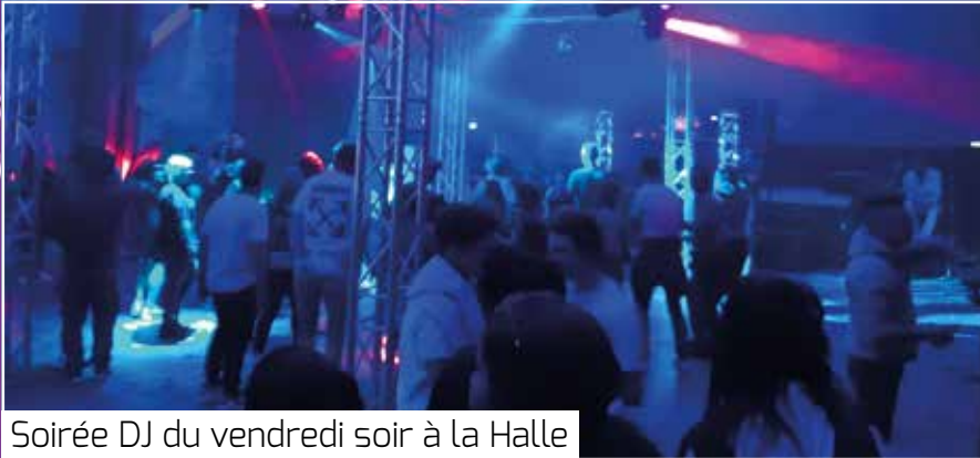
Soirée DJ du vendredi soir à la Halle

Concert du dimanche après-midi à la Halle avec un groupe cover de Jean-Jacques GOLDMAN