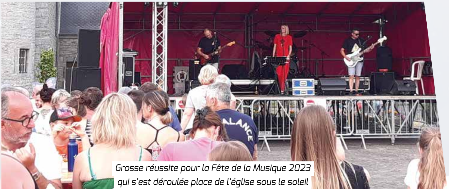
Grosse réussite pour la Fête de la Musique 2023 qui s'est déroulée place de l'église sous le soleil