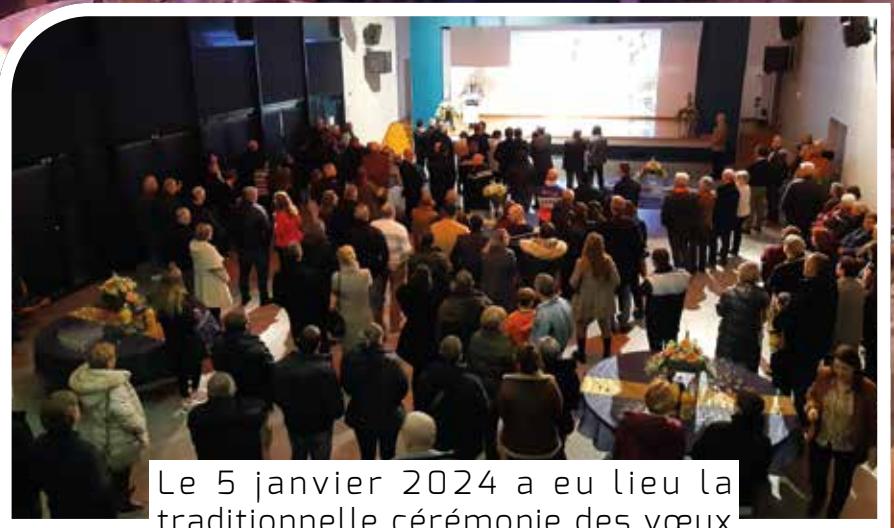
Le 5 janvier 2024 a eu lieu la traditionnelle cérémonie des vœux du Maire au complexe polyvalent en présence de nombreux élus et Calcéens.