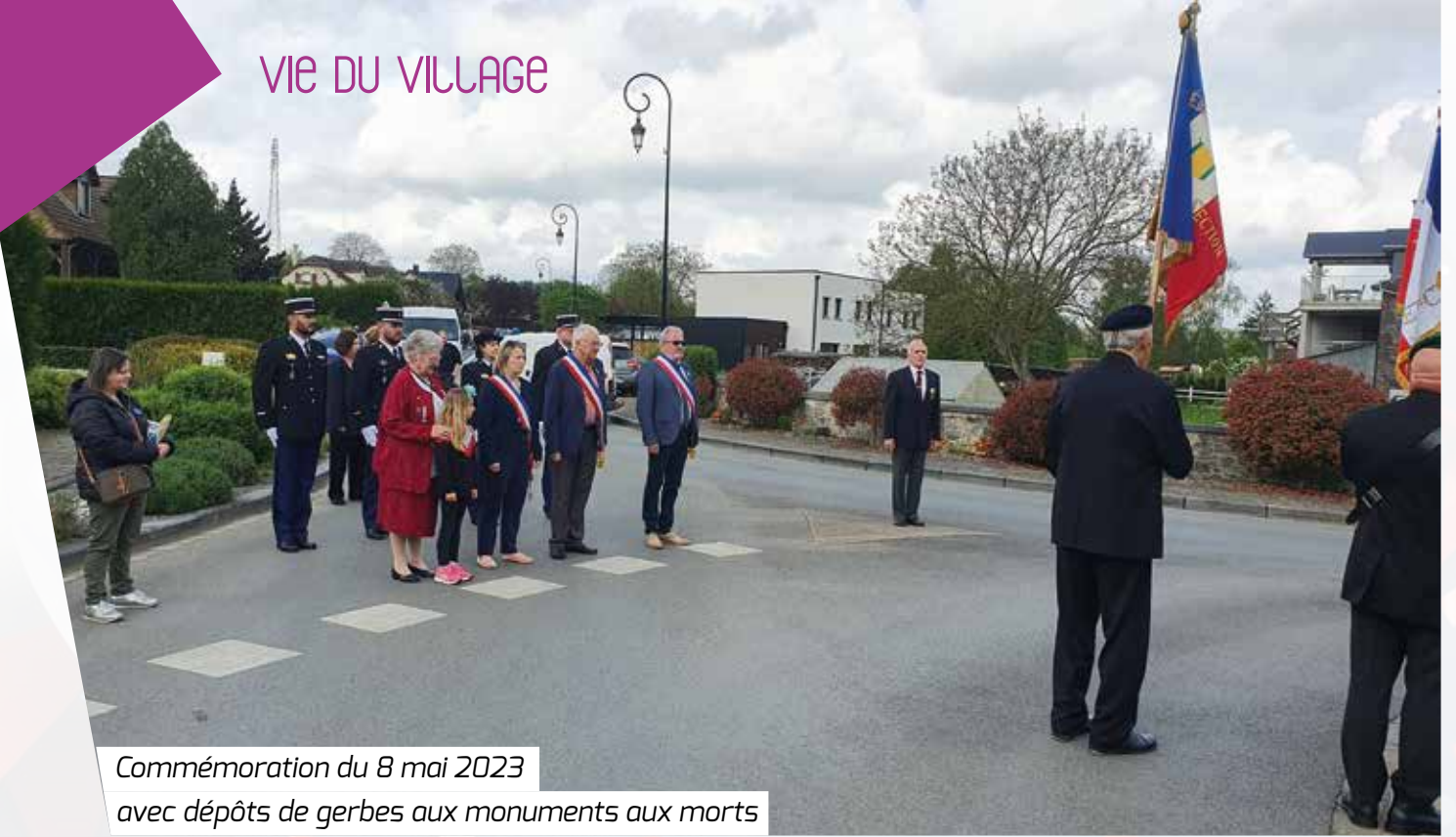
Commémoration du 8 mai 2023 avec dépôts de gerbes aux monuments aux morts