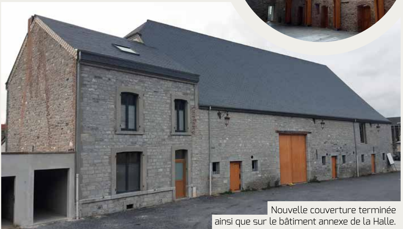
Nouvelle couverture terminée ainsi que sur le bâtiment annexe de la Halle.