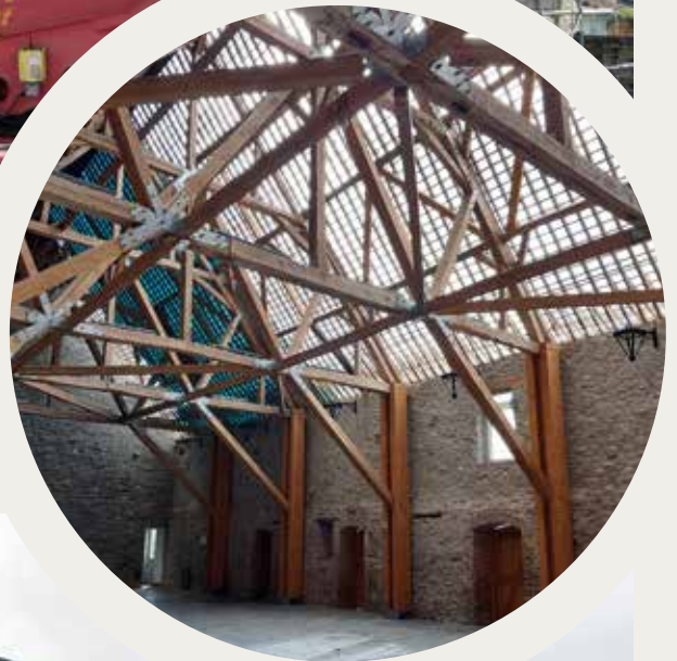
La structure des poutres d'origine de la Halle.