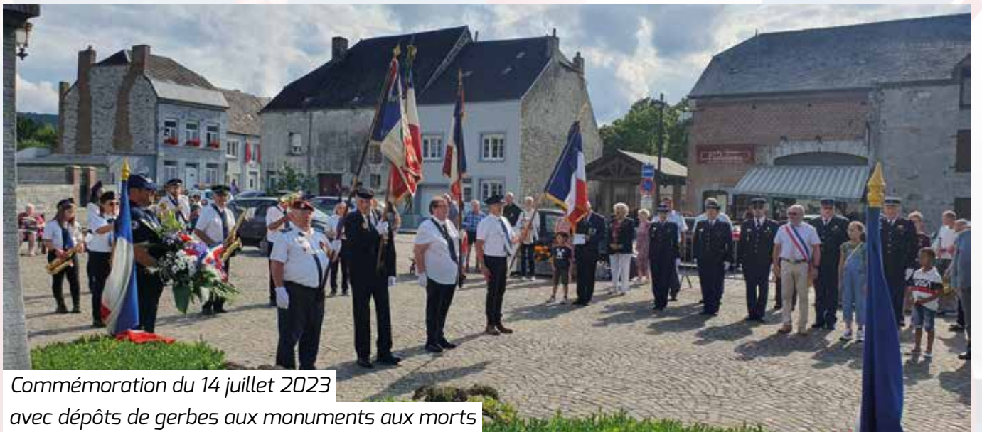
Commémoration du 14 juillet 2023 avec dépôts de gerbes aux monuments aux morts