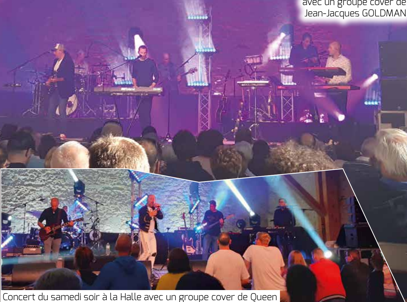
Concert du samedi soir à la Halle avec un groupe cover de Queen

Concert du dimanche après-midi à la Halle avec un groupe cover de Jean-Jacques GOLDMAN